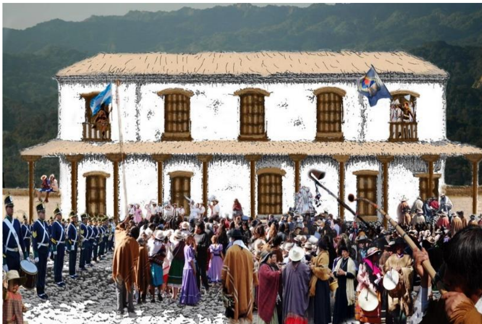
“Entrega de la Bandera al pueblo y gobierno de la ciudad de Jujuy”. Fotomontaje realizado por el ingeniero Joaquín Carrillo, Presidente del Instituto Belgraniano de Jujuy.

último, espero que sea e la aprobación de V. E. Dios guarde a V.E. muchos años. Jujuy, 26 de mayo de 1813. Manuel Belgrano (...). 3 Nota del general Manuel Belgrano al Gobierno Central en Buenos Aires.